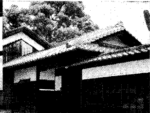
桜の庄兵衛ギャラリー

豊中市中桜塚2-1-30・35、 桜の庄兵衛ギャラリーへ。 FAX06(68852)3 270、Eメール syuhai@ fool-zakura.jp。 阪急岡町から徒歩10分。 ☎06(68852)327 0(午前9時〜正午)。