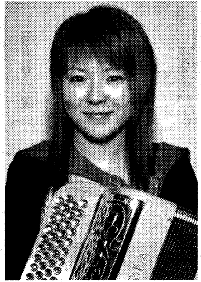
「とにかくマイナーイメージが強いし、色も黒が多い。日本でのアコーディオンのイメージを上げたい」。特注で彩色してもらった*愛器、はピンク~オレンジ~黄色のグラデーション